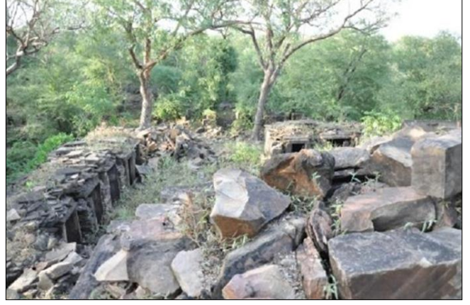
मंदिर-परिसर का विहंगम दृश्य, धनायचा