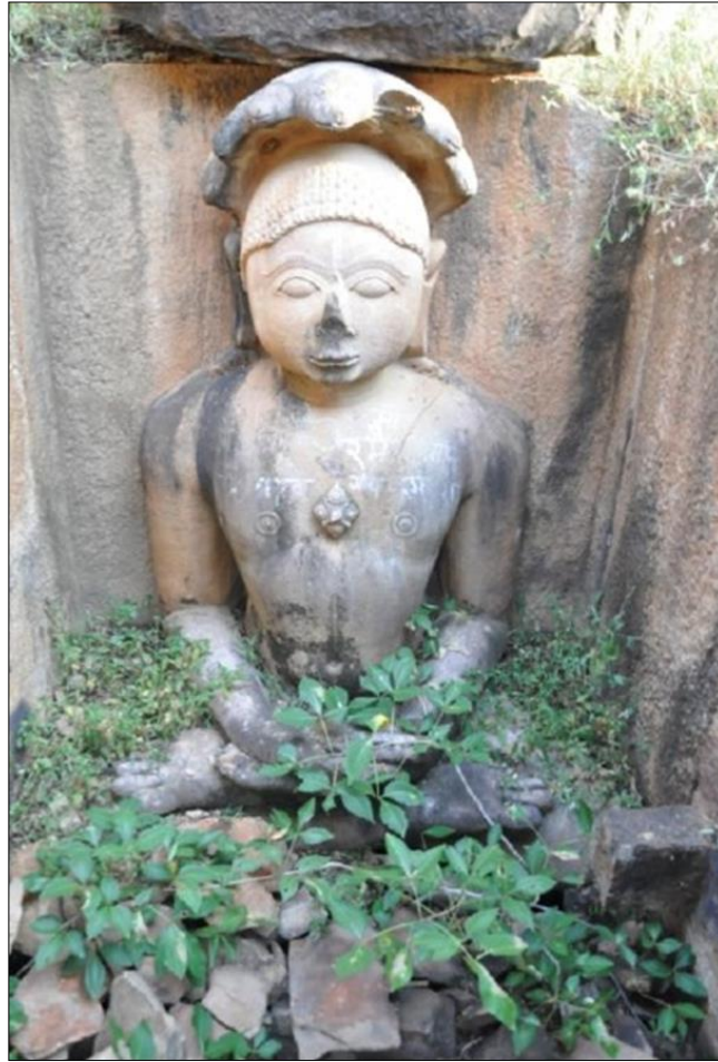
मंदिर परिसर में पदमासन पार्श्वनाथ, धनायचा